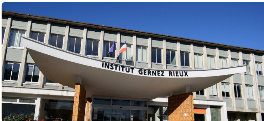
Prospectus Sponsors et exposants

Avec une communauté de près de 16 000 professionnels, le Centre Hospitalier Universitaire de Lille est l'un des plus grands campus de santé en Europe du Nord. En tant qu'hôpital universitaire de référence et de recours, axé sur l'enseignement, l'innovation et la recherche, il traite des pathologies graves nécessitant une plateforme médico-technique de pointe et une expertise médicale spécialisée.